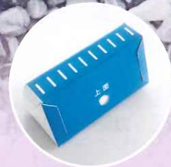
組立式ハンマーヘッド ノズル付き