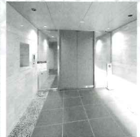
マンションのエントランス